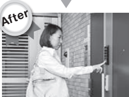
電子錠にタッチして開錠

中古マンションのリフォーム、リノベーション対応商品のなかで一番人気の商品は『セリユールプレミア』集合住宅用「エントランス連動型スマートシステム」(左写真参照)です。