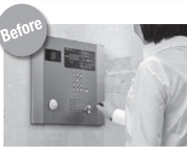
鍵を取り出し開錠