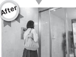
近づくだけで開錠