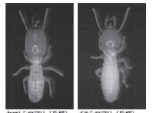
ヤマトシロアリ(兵蟻) イエシロアリ(兵蟻)